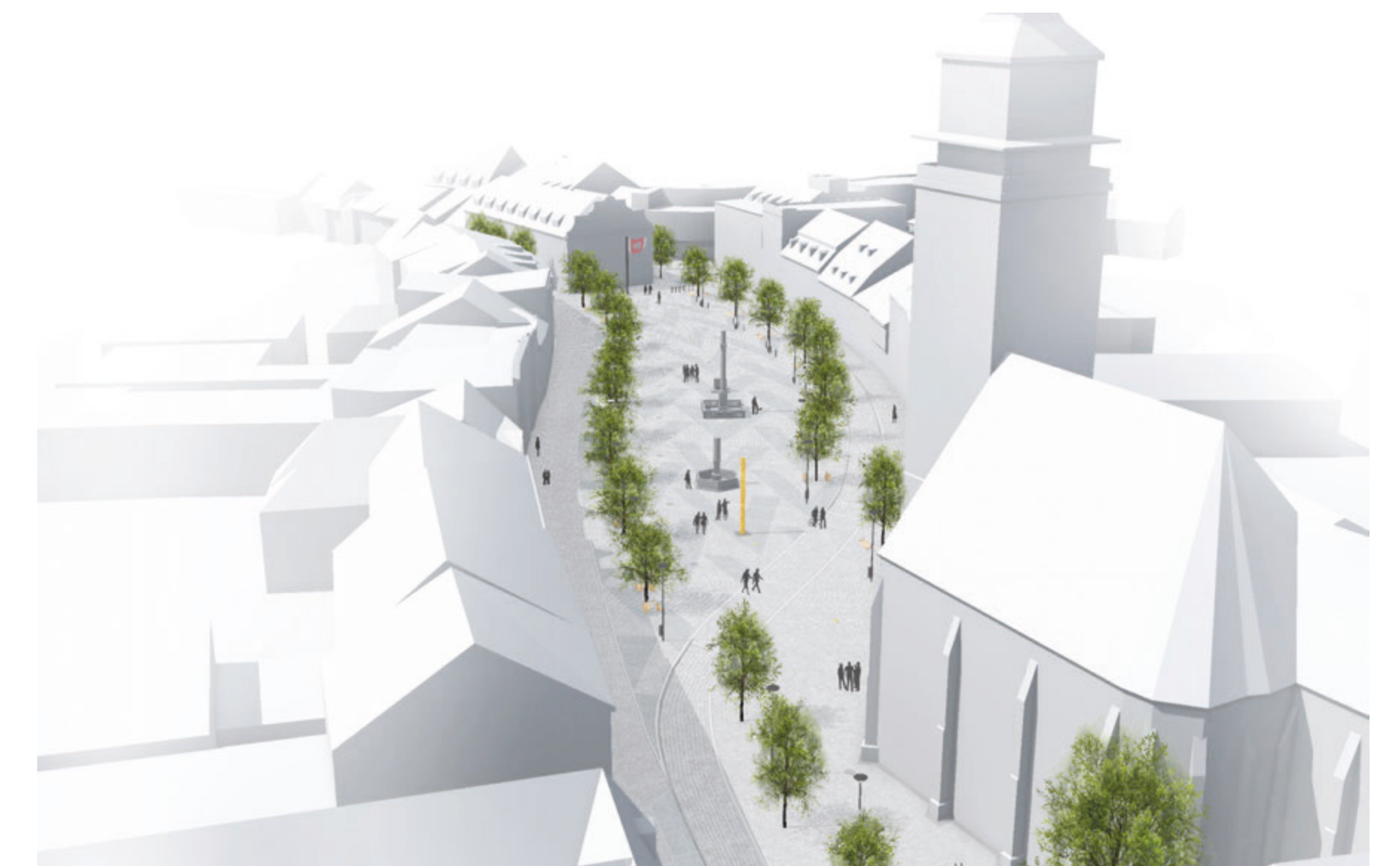
NADHLEDOVÁ PERSPEKTIVA, POHLED OD ULICE KOMENSKÉHO