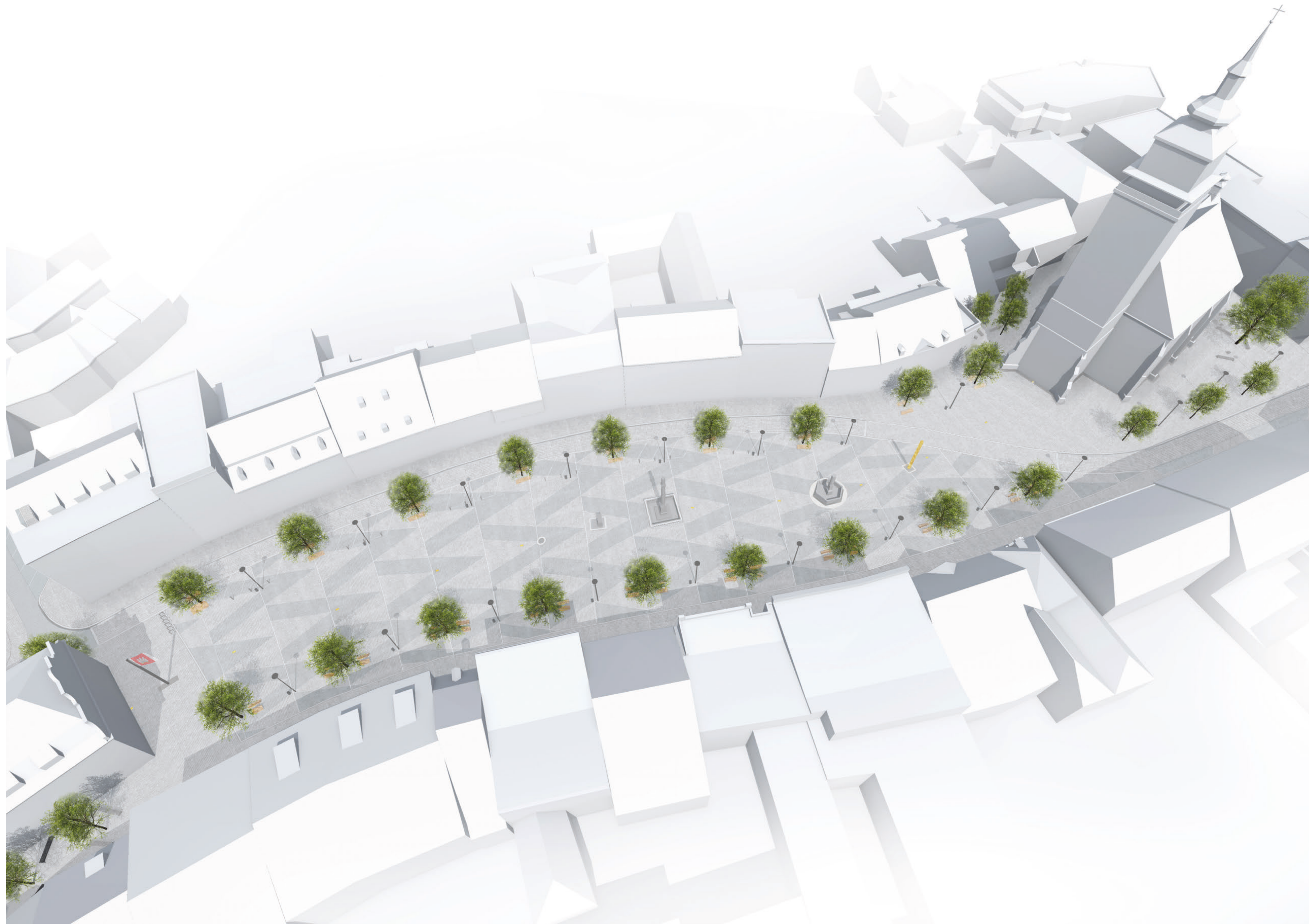
NÁMĚSTÍ VELKÉ MEZIŘÍČÍ, PTAČÍ PERSPEKTIVA