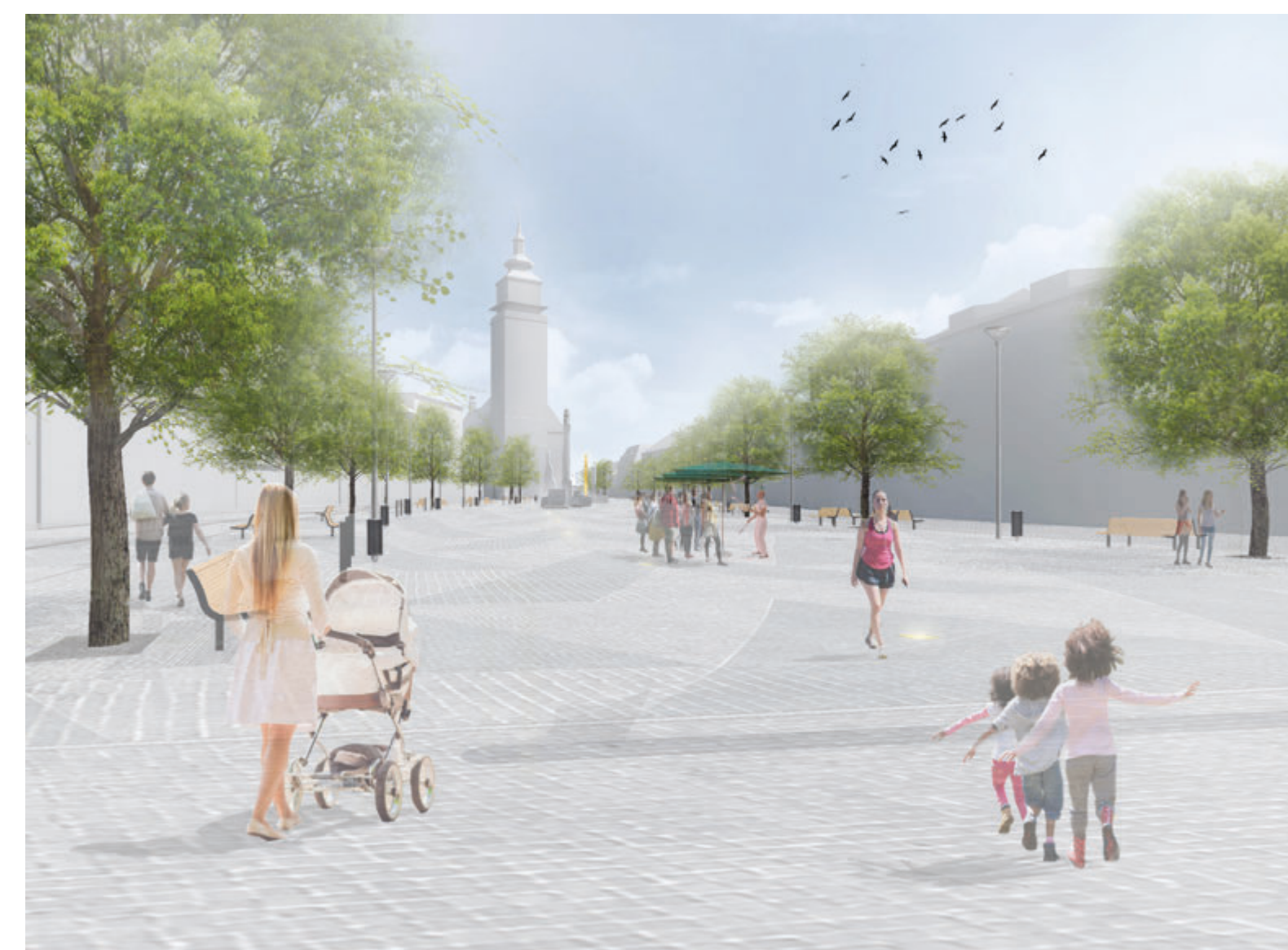
ULIČNÍ PERSPEKTIVA II, POHLED OD RADNICE NA NÁMĚSTÍ