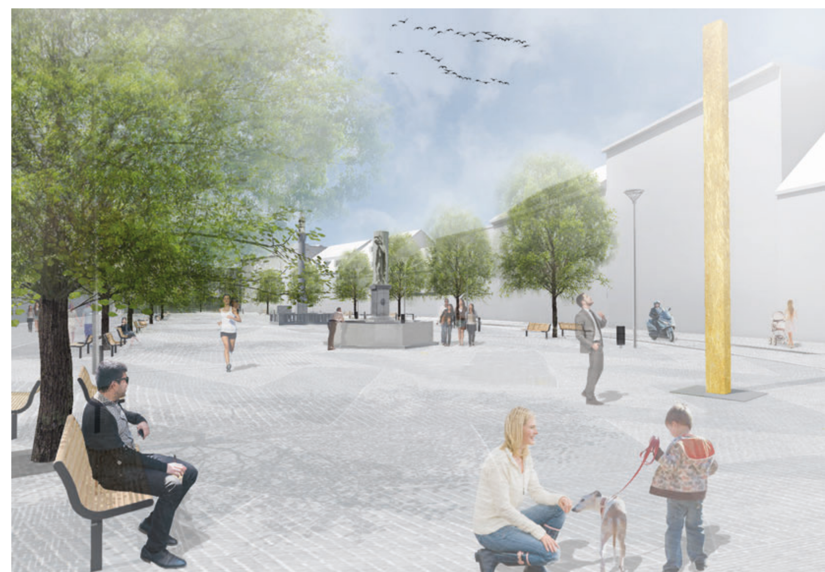
ULIČNÍ PERSPEKTIVA I, POHLED OD KOSTELA NA NÁMĚSTÍ