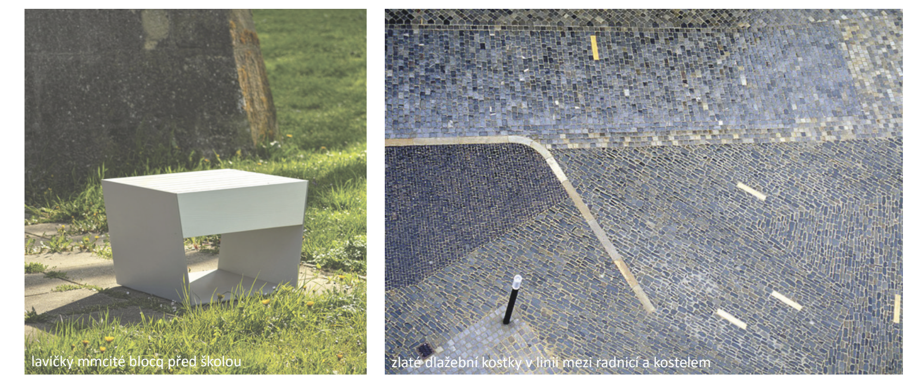
lavičky mramřité bloky před školou