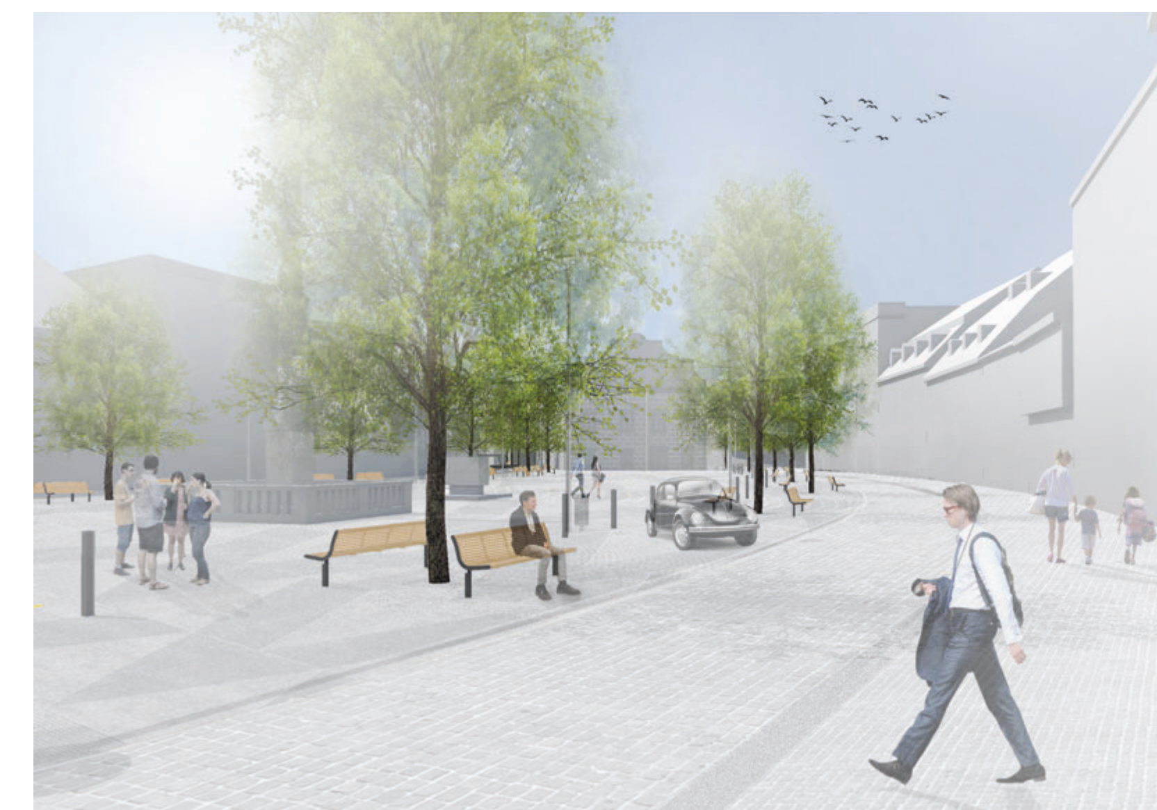
ULIČNÍ PERSPEKTIVA III, POHLED OD KOSTELA NA RADNICI