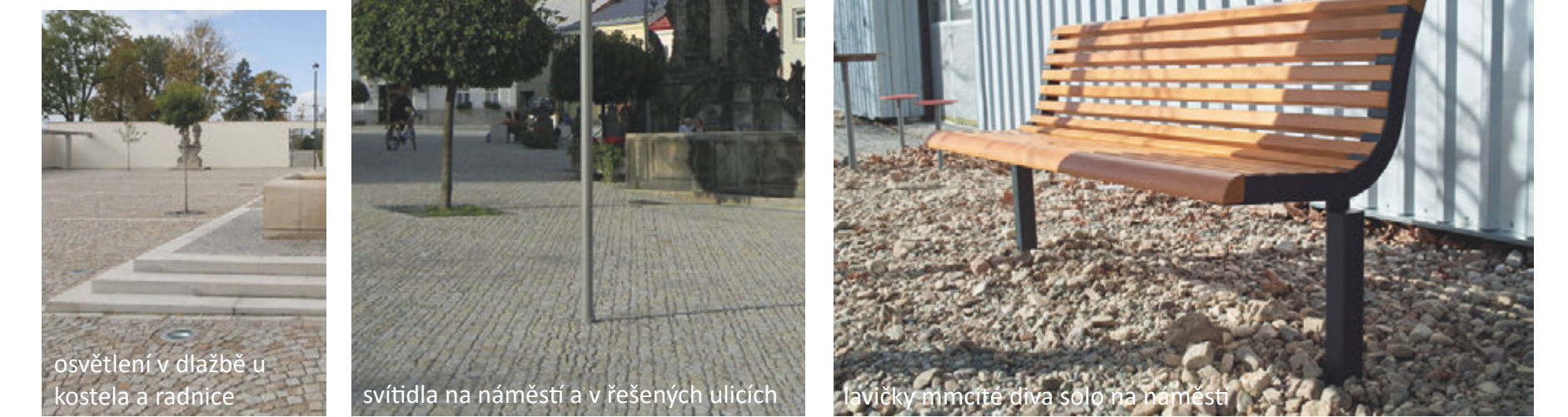
osvětlení v dlažbě u kostela a radnice