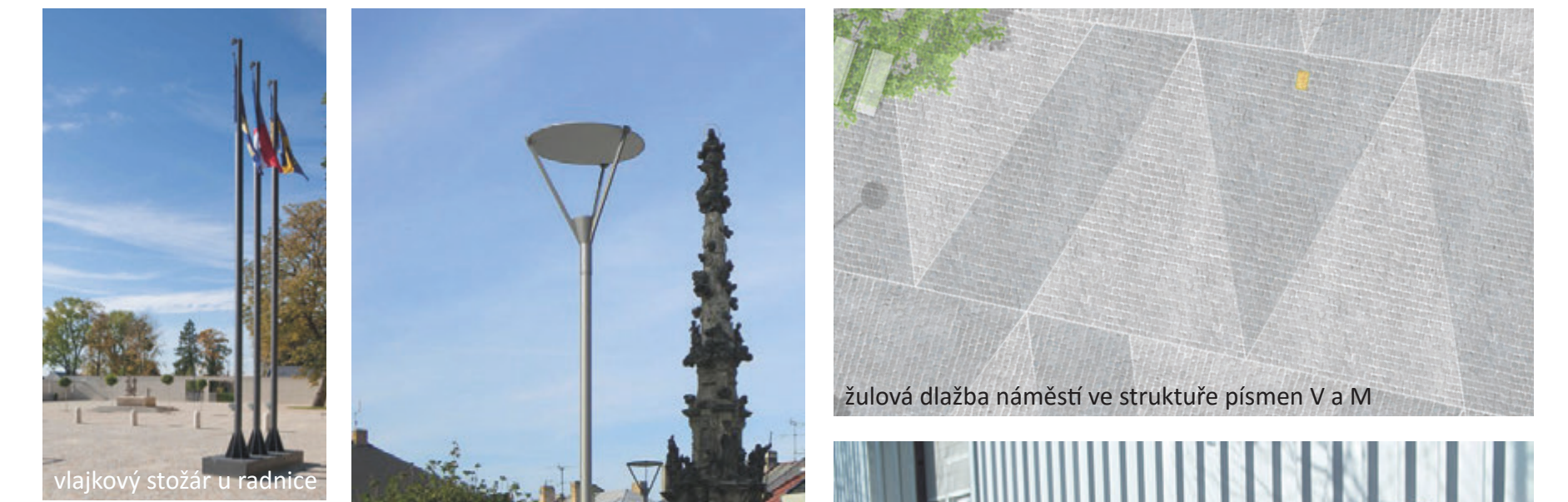
vlajkový stožár u radnice

Povrch všech dopravních komunikací je řešen pomocí žulových dlažebních kostek, plocha náměstí je pokryta kamennou dlažbou menšího formátu než u vozovky. Samotný prostor náměstí (pomyslný ostrov), kde se konají všechny akce nebo se tu člověk jen tak zastaví, má v rámci dlažby viditelnou strukturu, která tak má oddělovat toto místo od okolí. Dlažební formát je skládan tak, že zobrazuje písmena V a M a to ve směru kolmém k liniím náměstí, aby tak potvrdil princip zastavení se v této části.