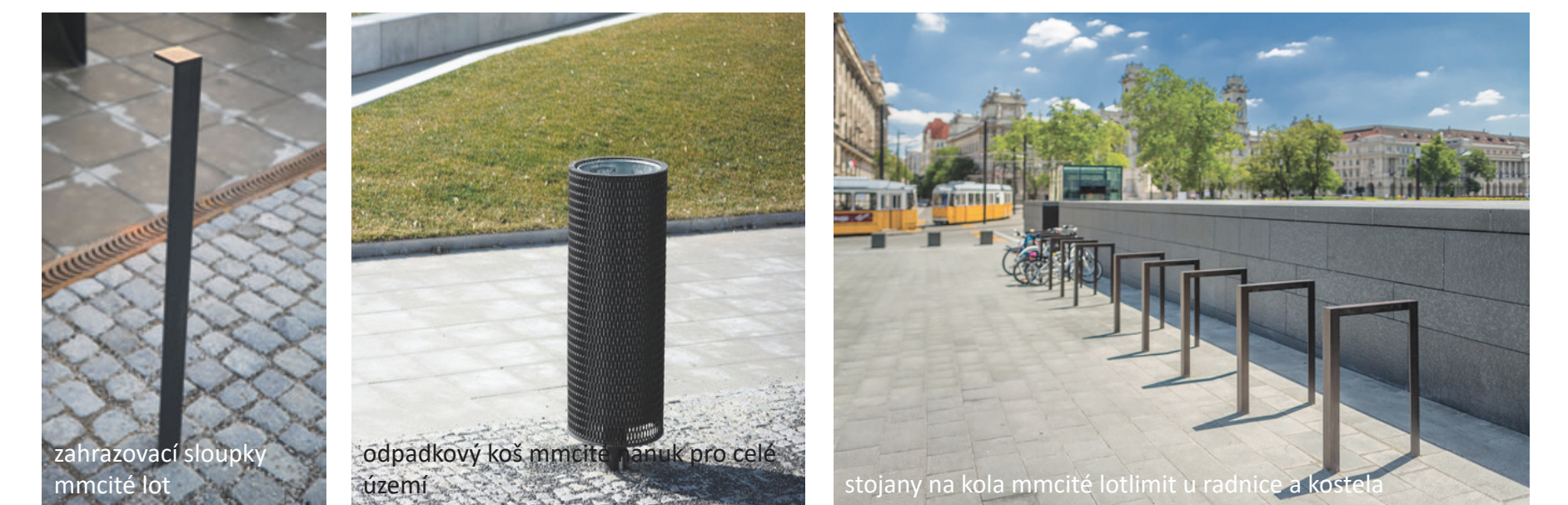
zahrazovací sloupky mramřité lot