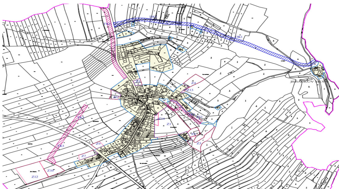
Obrázek 1 Výřez z výkresu ZČÚ, vyznačené zastavitelné plochy v ÚP Vidonín.

Při naplňování ÚP Vidonín od doby jeho vydání nebyly zjištěny negativní dopady na udržitelný rozvoj území. Územní rozvoj obce neohrožil přírodní, krajinné ani kulturní hodnoty území.