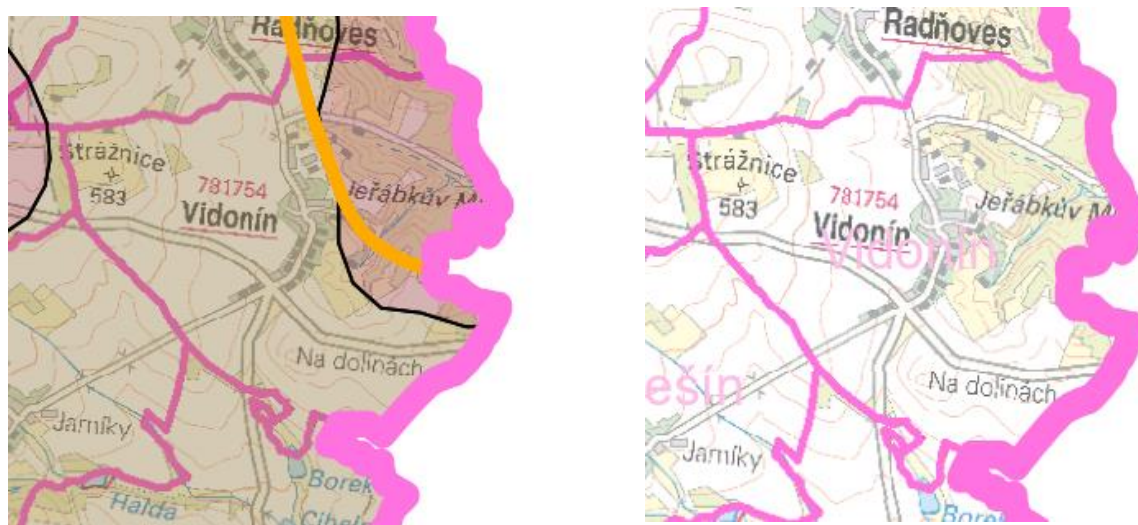
Obrázek 2 a 3: výřez ze ZÚR Kraje Vysočina – Výkres Oblasti se shodným krajinným typem a Výkres ploch a koridorů, včetně územního systému ekologické stability.

Zásady pro činnost v území a rozhodování o změnách v území pro výše uvedenou oblast krajinného rázu ÚP splňuje, ÚP nevymezuje plochy pro výškové stavby ani nové plochy rekreace.