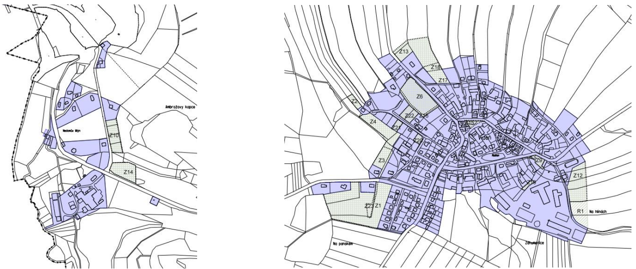
Obr. 2 Výřez z výkresu základního členění – zastavitelné plochy vymezené v ÚP Vídeň

Do doby zpracování zprávy o uplatňování byly využity hlavně plochy Z9 a Z21, které jsou zastavěny ze 100 %. V každé ploše byl postaven jeden rodinný dům. V ploše Z10 byl dosud postaven 1 RD, zbylé stavební pozemky nebyly zastavěny. Největší zastavitelná plocha Z1 a s ní související plocha veřejného prostranství Z23 prozatím zastavěna není, ale úřad územního plánování vydal celkem 8 závazných stanovisek pro budoucí výstavbu 8 RD. V lokalitě v současné době dochází ke zasíťování. Dále je využita plocha Z15, kde vzniklo veřejné prostranství se zelení. Ostatní rozvojové plochy využity nebyly.