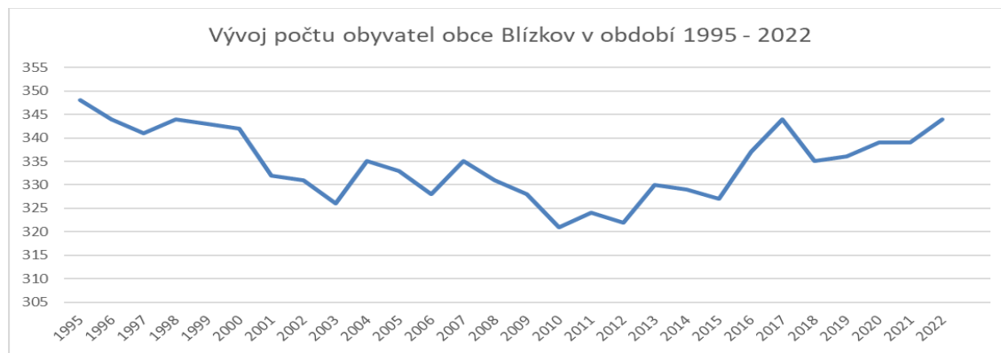
Obrázek 3: Graf vývoje počtu obyvatel v obci Blízkov, data jsou vždy k 31. 12. 2022.

Rozvoj obce s ohledem na vývoj počtu obyvatel je znázorněn grafem (viz. Obr. 1). Počet obyvatel v obci Blízkov měl do roku 2003 klesající charakter. Od té doby se počet obyvatel pohyboval okolo 330 obyvatel, v posledních letech je patrná vzrůstající tendence počtu obyvatel.