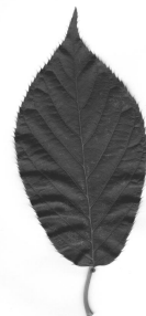
okrasná třešeň - sakura