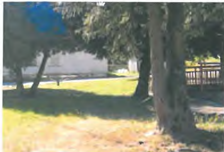
stav v r. 2012 – kolotoč u požární nádrže