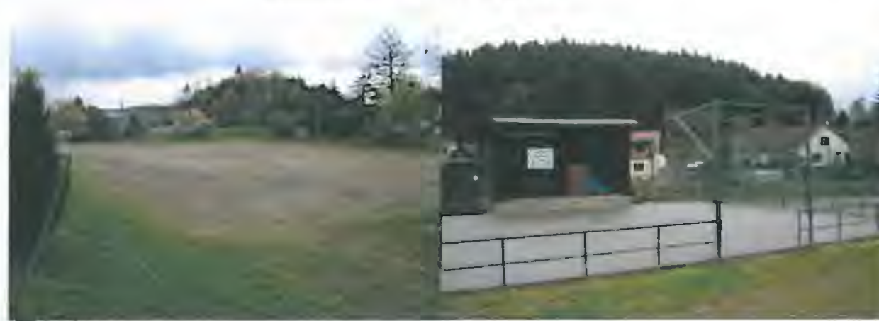
aktuální stav v 4/2016