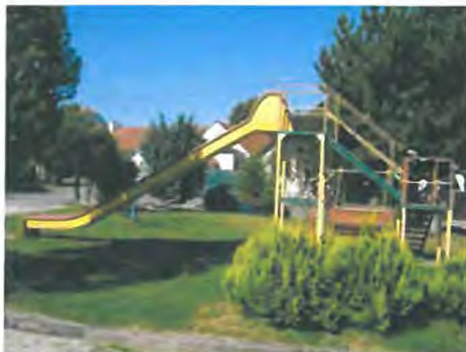
stav v r. 2012