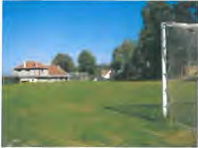
stav v r. 2012 – zatravněná plocha – fotbal