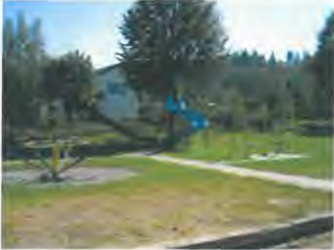
stav v r. 2012 – dětskě hřišťe u kulturněho domu