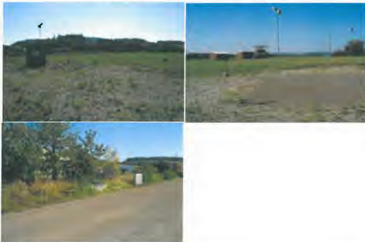
stav v r. 2012 – hasičské hřiště