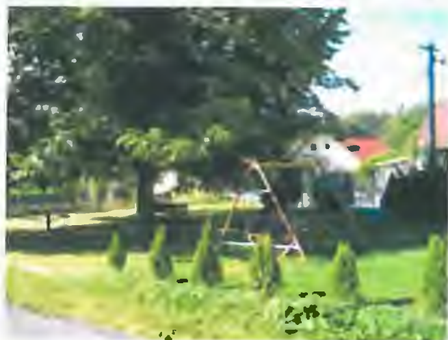
stav v r. 2012