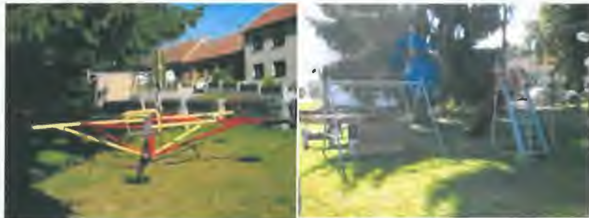
stav v r. 2012 – hřiště u zastávky