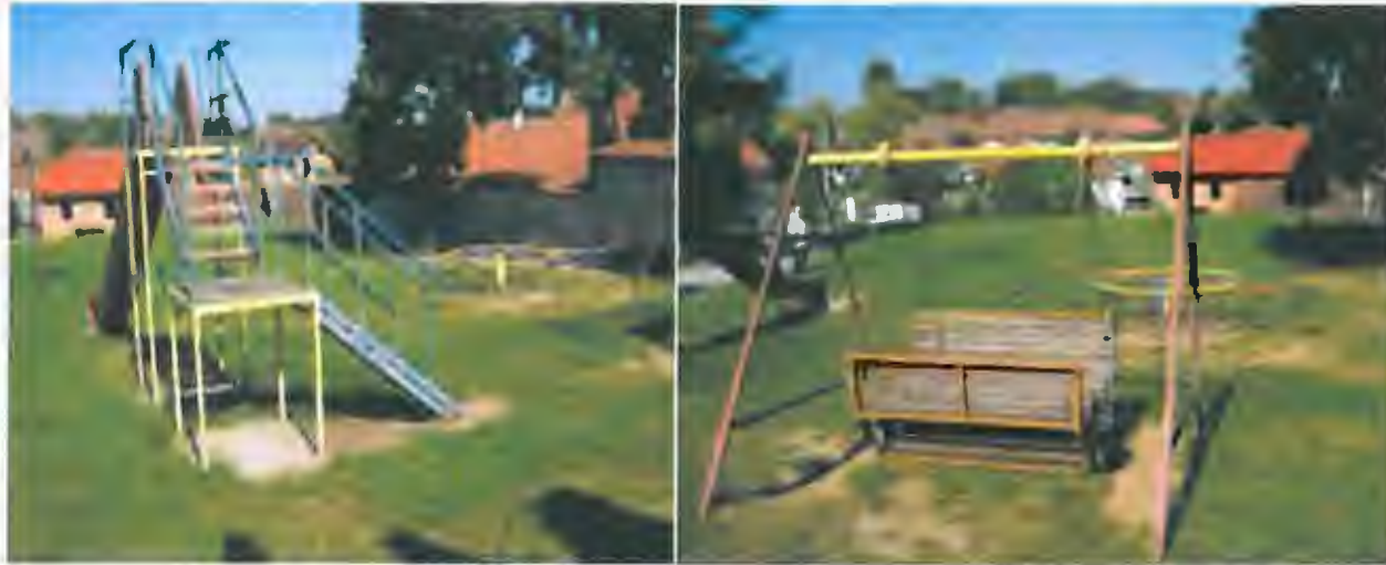
stav v r. 2012 – dětské hřiště pod kulturním domem