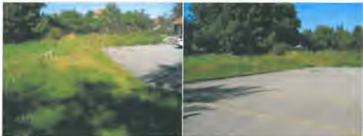
stav v r. 2012 – hřiště za hasičskou zbrojnicí