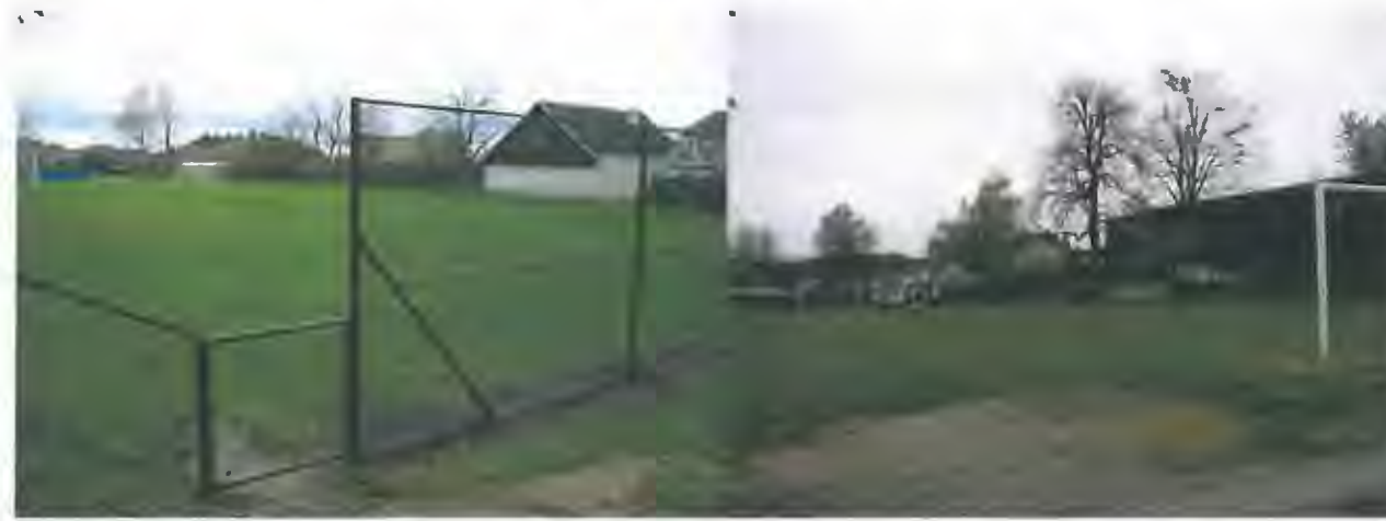
aktuální stav v 4/2016

Ponechat. Opravit branky, zachovat sportovní charakter.