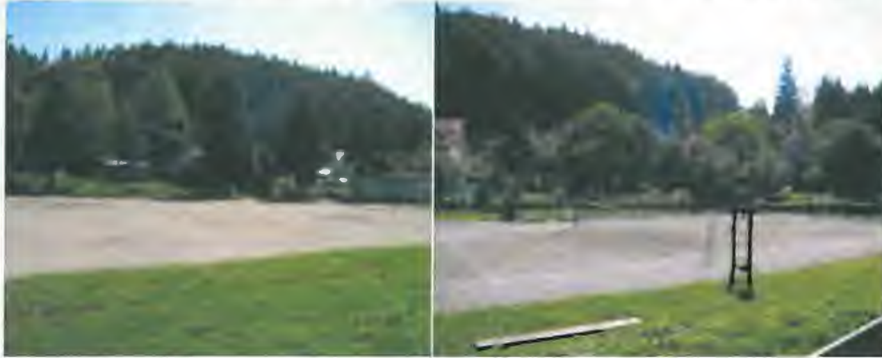
stav v r. 2012 – fotbalové hřiště, street basket, volejbalové kurty