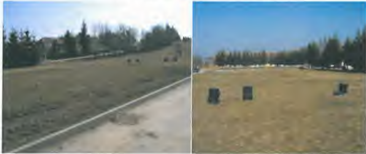
stav v r. 2012 – víceúčelové hřiště