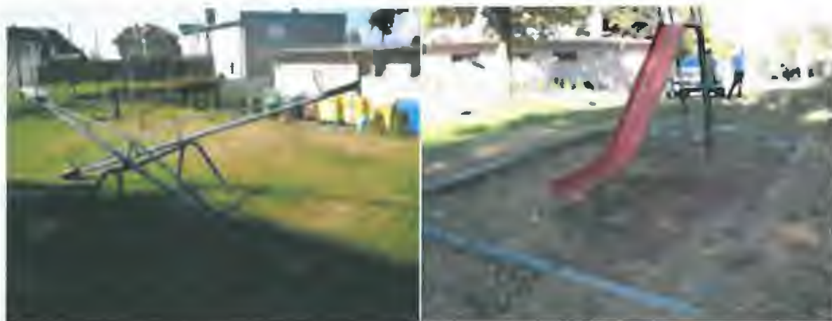
stav v r. 2012 – hřiště u kulturního domu